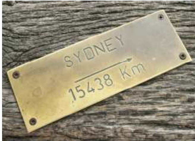
Distansutbildning - Studera där du bor.

Jag tar gärna emot förslag på områden som du upplever passar bra för egen coaching i egen takt.