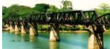
Bron över floden Kwai

4. Så det bästa av allt. Vi siktade på att ordna resan för 21 000 kr och räknade med att det skulle bli en tuff uppgift med tanke på kronans låga värde i år och de ökade flygpriserna (bl.a. genom ökade flygbränslepriset). Det verkade också vara en tuff uppgift eftersom vi inte ville sova i tält utan siktade på hotell med bra kvalitet.